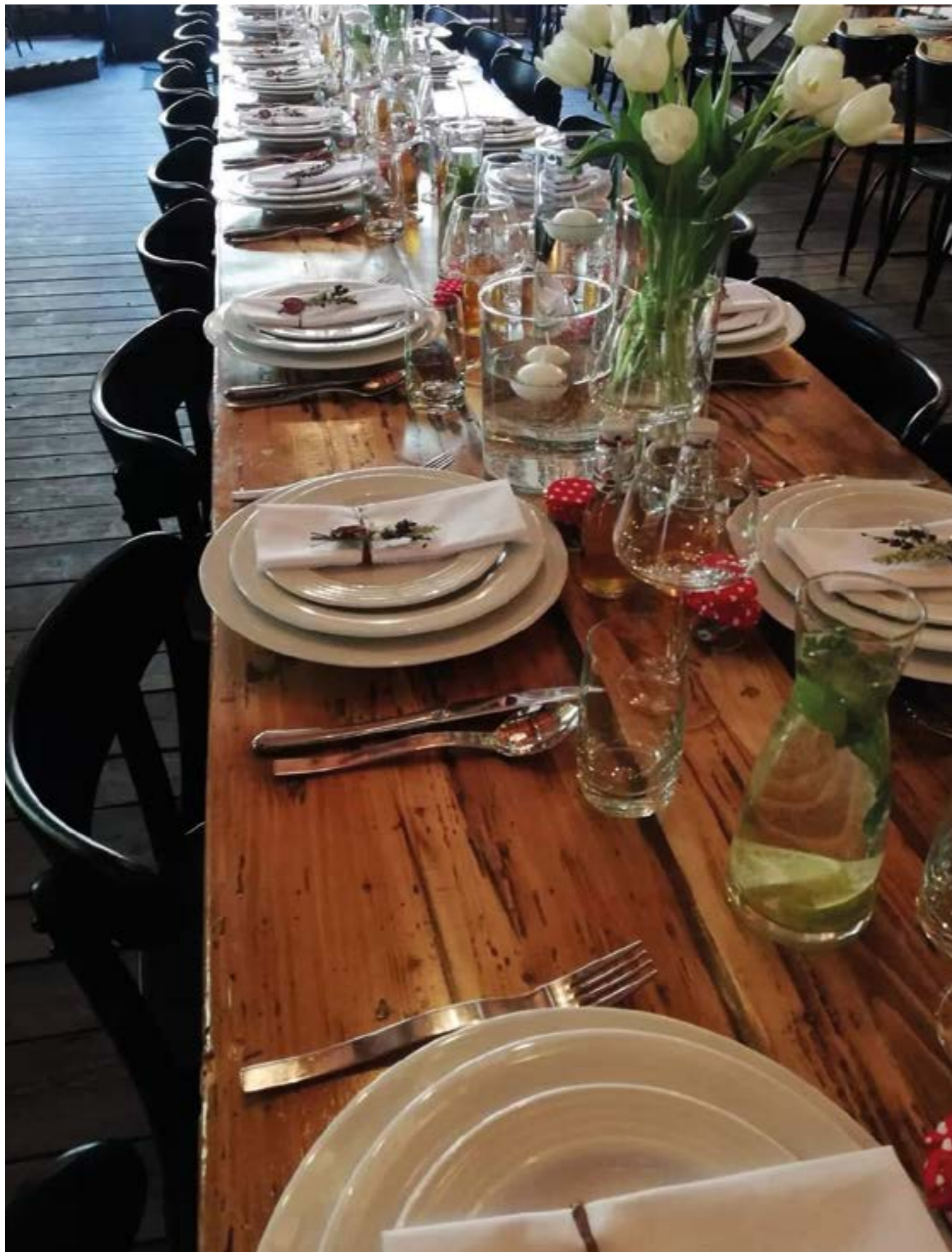
Počernický pivovar hlavní restaurace