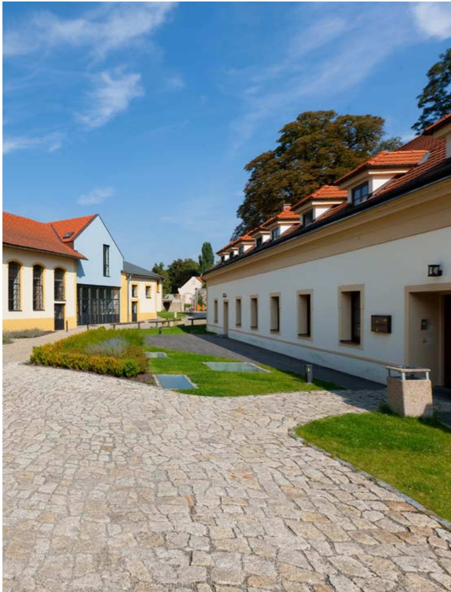
terasa u sálu Špejchar pro svatební obřad